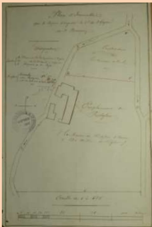
Plan de situation Archives de la Dordogne