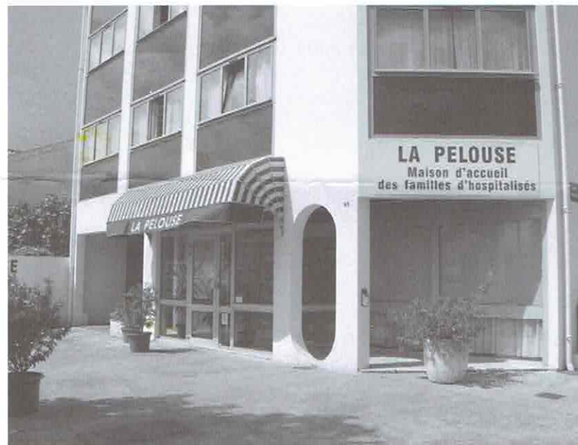
Maison d'Accueil des Familles d'Hospitalisés, 65 rue de la Pelouse de Douet 33000 Bordeaux

Pour réserver une chambre il est recommandé de s'y prendre assez tôt, soit en téléphonant au 05.56.93.17.33 soit en déposant une demande sur le site internet de La Pelouse : www.hebergement.lapelouse.bordeaux.fr .